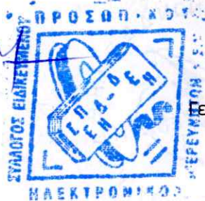
Φ. ΟΨΙΜΟΥΛΗ Γενική Γραμματέας