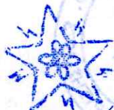
Αν. ΑΔΑΜΟΠΟΥΛΟΣ Γενικός Γραμματέας