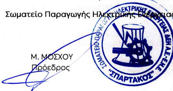
Μ. ΜΟΣΧΟΥ Πρόεδρος