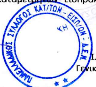
Ι. ΚΑΛΠΟΥΖΟΣ Γενικός Γραμματέας