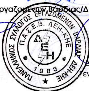
Α. ΑΡΣΕΝΙΔΗΣ Γενικός Γραμματέας