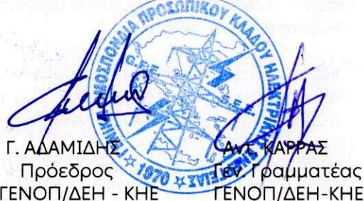
Γ. ΑΔΑΜΙΔΗΣ Πρόεδρος ΓΕΝΟΠ/ΔΕΗ - ΚΗΕ Αντ. ΚΑΡΡΑΣ Γεν. Γραμματέας ΓΕΝΟΠ/ΔΕΗ-ΚΗΕ