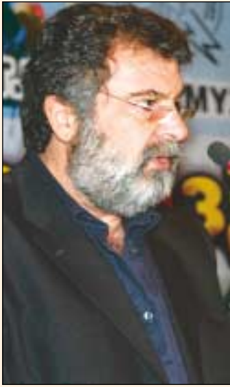
Του Προέδρου της ΕΤΕ/ΔΕΗ ΒΑΓΓΕΛΗ ΚΑΤΣΙΝΗ

Μέσα από τους αγώνες και την ενεργό συμμετοχή μας δίνουμε ώθηση στο εργατικό κίνημα της Πατρίδας μας