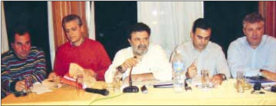
Το Προεδρείο της ΕΤΕ/ΔΕΗ κατά τη διάρκεια του Δ.Σ.

Ολοκληρώθηκαν με επιτυχία οι εργασίες του Διοικητικού Συμβουλίου της ΕΤΕ/ΔΕΗ που διεξήχθη στην Πτολεμαΐδα την Δευτέρα 3 Δεκεμβρίου 2007.