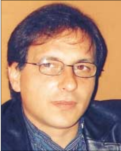
Του Βλαστού Άγγελου Υπευθύνου της έκδοσης

Αυτό το κείμενο είναι αφιερωμένο εξαιρετικά σε όσους “τρέχουν” νυχθημερόν να κάνουν την ΔΕΗ ανταγωνιστική.