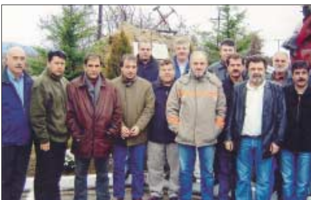
Μέλη της ΕΤΕ/ΔΕΗ στο περιθώριο των εκδηλώσεων εορτασμού της προστάτιδας των λιγνιτωρύχων Αγίας Βαρβάρας.