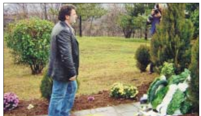
Ο Πρόεδρος της ΕΤΕ/ΔΕΗ καταθέτει στεφάνι στη μνήμη των λιγνιτωρύχων που έχασαν τη ζωή τους κατά τη διάρκεια εκτέλεσης του καθήκοντος.