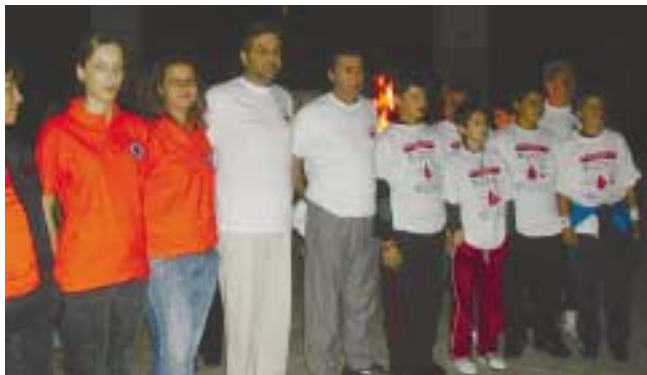
Μέλη της ΕΤΕ/ΔΕΗ που έλαβαν μέρος στην Πανελλήνια Λαμπαδηδρομία των Εθελοντών Αιμοδοτών.

Στο πλαίσιο της διάδοσης της εθελοντικής αιμοδοσίας και αποδεικνύοντας για ακόμη μια φορά την κοινωνική ευαισθησία και την αλληλεγγύη προς τον συνάνθρωπο, μέλη της ΕΤΕ/ΔΕΗ συμμετείχαν στην Πανελλήνια Λαμπαδηδρομία των Εθελοντικών Αιμοδοτικών Σωματείων όλης της Ελλάδας, η οποία ξεκίνησε από τα Γιάννενα και ολοκληρώθηκε στο Ηράκλειο της Κρήτης, ενώ ενδιάμεσα πέρασε σχεδόν από όλη την Ελλάδα. Κύριος σκοπός της Λαμπαδηδρομίας αποτέλεσε η ευαισθητοποίηση όλων των πολιτών, προκειμένου να δουν ότι το αίμα πρέπει να δίνεται εθελοντικά γιατί μπορεί να το χρειαστεί και να το χρησιμοποιήσει οποιοσδήποτε το έχει ανάγκη.